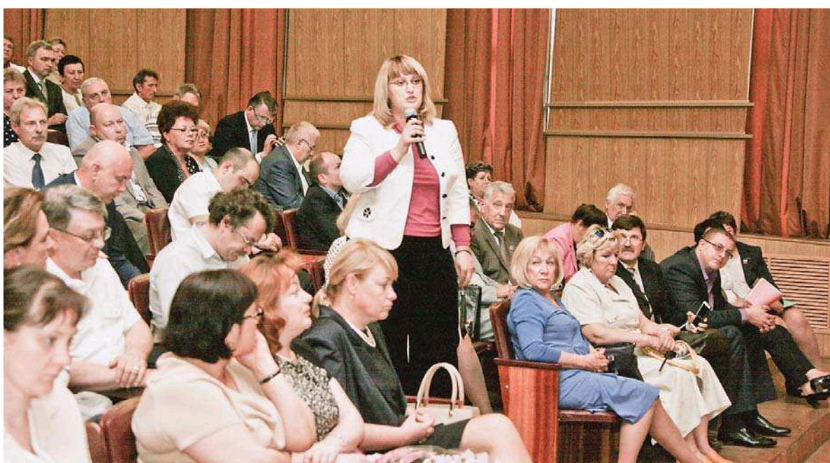
Идёт заинтересованный разговор

из 17. Удалось приблизить выполнение исследований к учреждениям здравоохранения, заметно сократить долю ручного труда и сроки проведения экспертиз, повысить производительность труда. Теперь мы можем проводить количественные определения лекарственных веществ в крови, определять крайне малые (следовые) количества наркотических и психотропных веществ в биологических объектах (в том числе в волосах), а также оперативно исследовать генетический материал в случае его массового